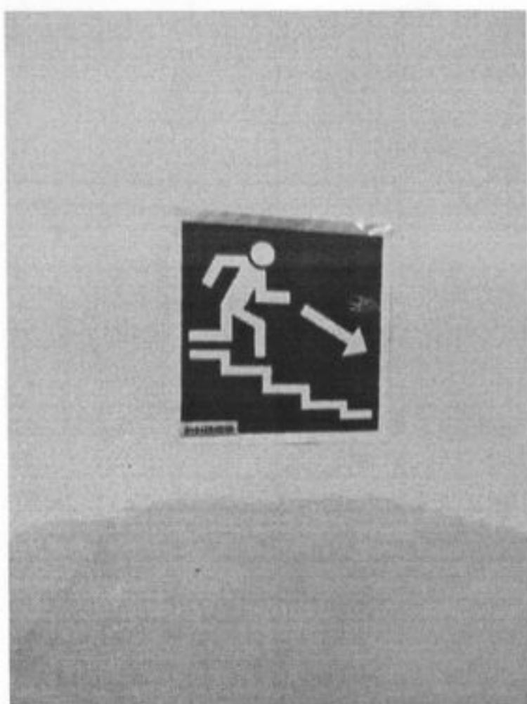
Табличка направление движения