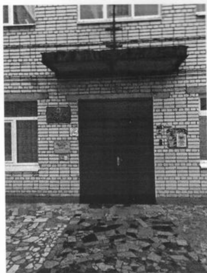
Вход в здание