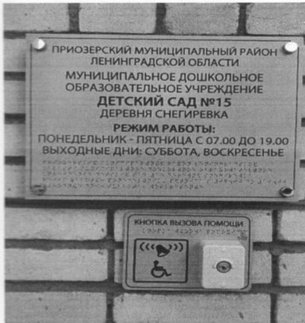
Кнопка вызова, Таблица Брайля