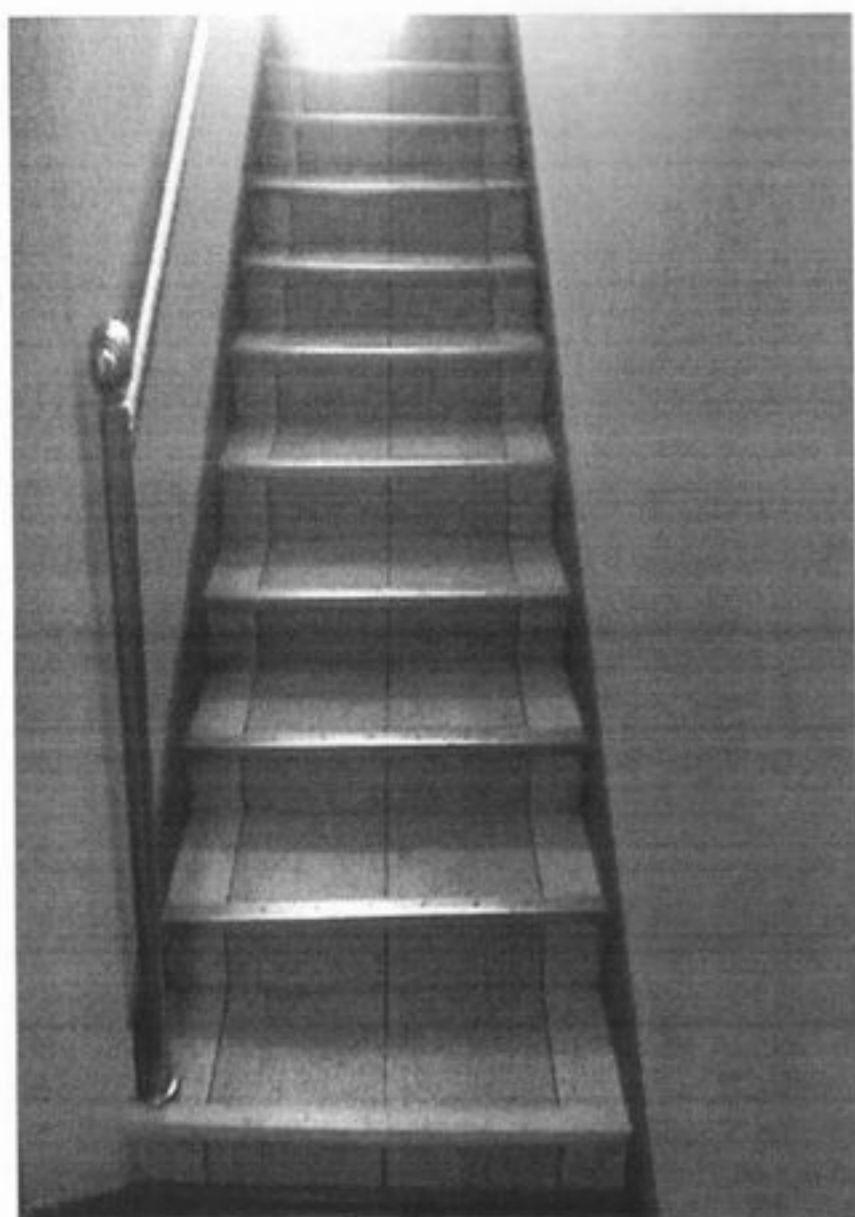
Лестница с поручнями и ограничительной лентой