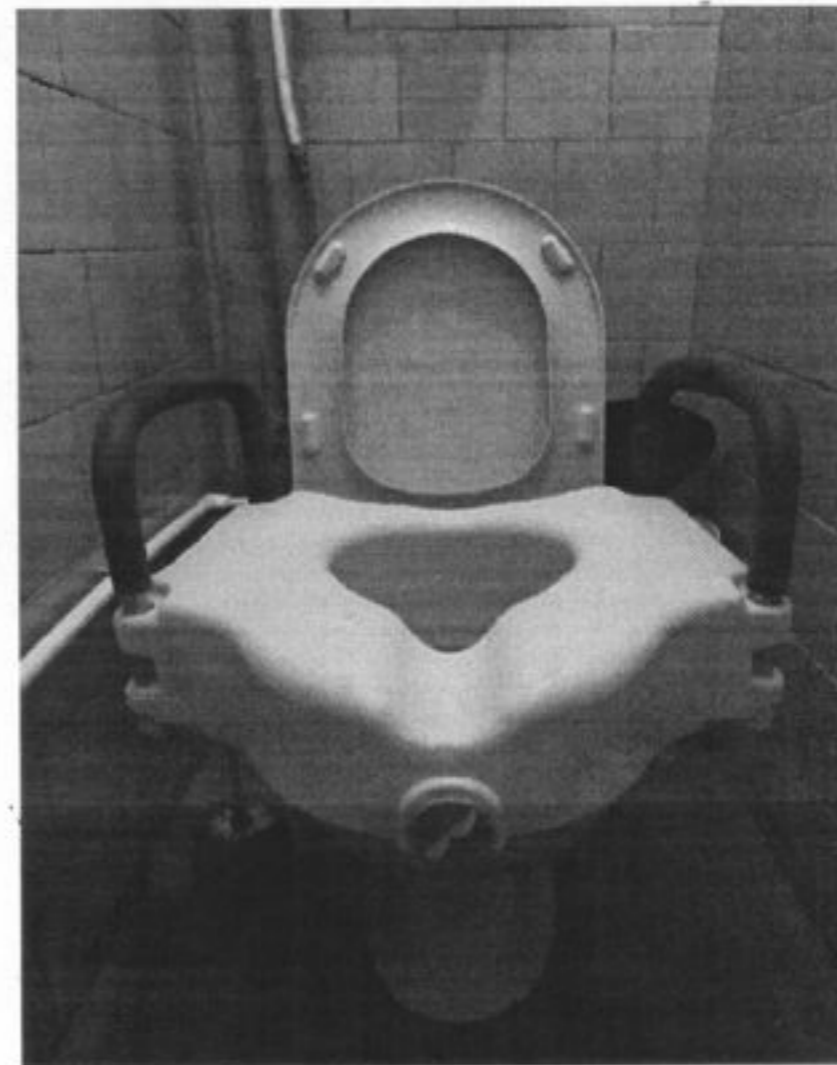
Накладка с поручнями для унитаза