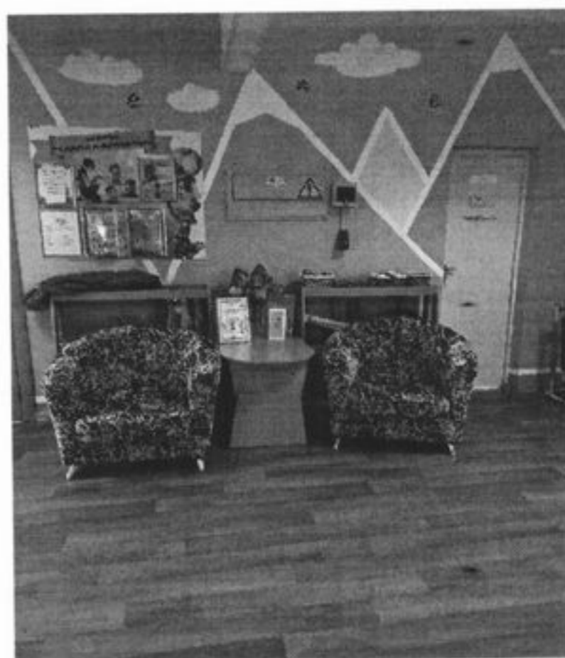
Место для ожидания. Холл 2 этажа