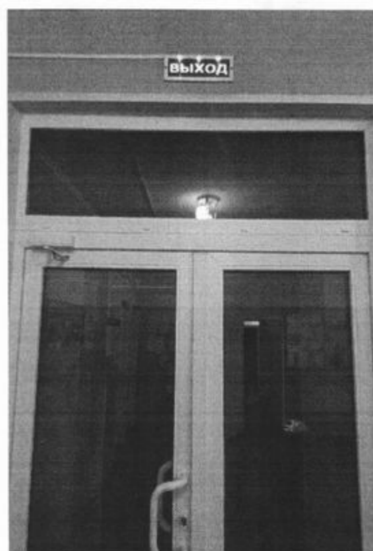
Табличка ВЫХОД Дверь