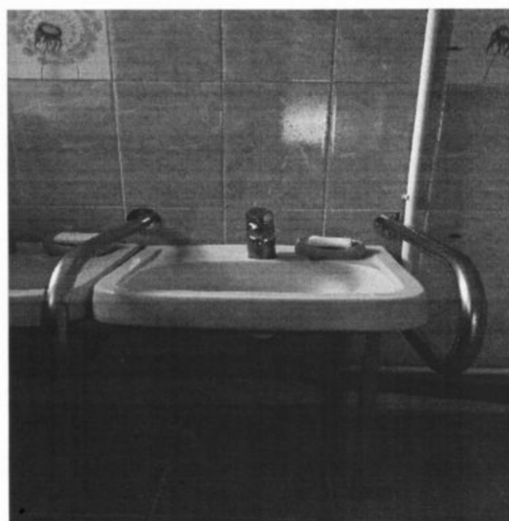
Раковина с поручнями