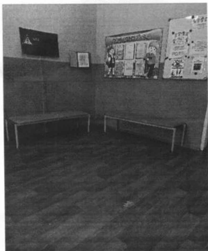
Место для ожидания. Холл 1этаж